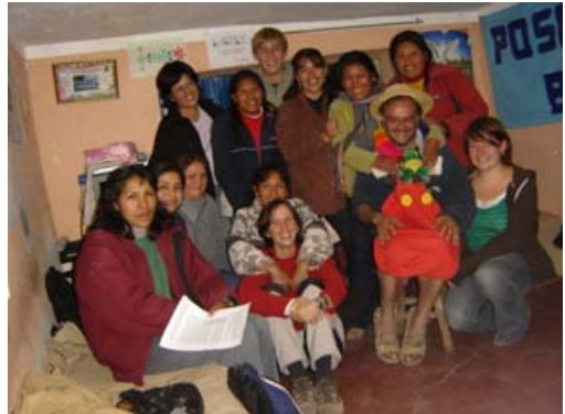
Un grupo de Voluntarios vivo

Para todos ellos, GRACIAS POR LA GENORIDAD PARA SER UNA PIEDRA MÁS EN LA CONSTRUCCIÓN DE LA POSADA.