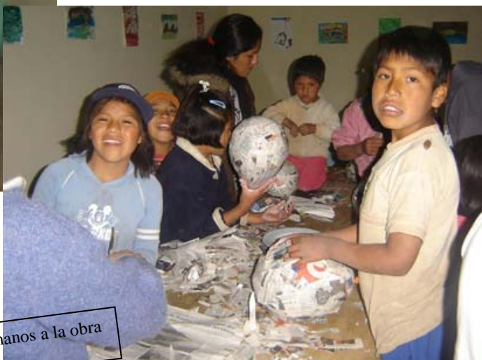
Taller de Caretas: manos a la obra