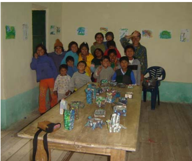
Exposición de trabajos del Taller de Pintura y Escultura