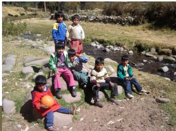
Paseo por el campo de los más pequeños

(se pueden ver más fotos en la web: http://perso.wanadoo.es/posadabelen/hacemos.htm#actividades )