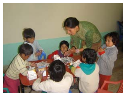
Disfrutando la renovada Sala de Talleres