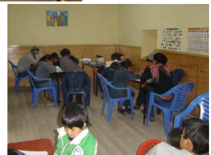
Sesión de estudio en la nueva Sala