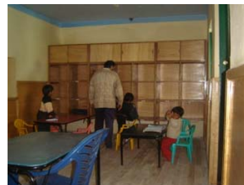
Nueva Sala de Estudio. Los más pequeños haciendo toma de sus casilleros

Para el siguiente cuatrimestre nos queda acondicionar lo que será la sala de biblioteca, con computadora incluida y todos los materiales de consulta oportunos.